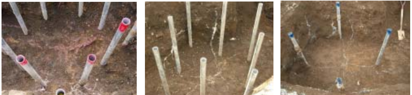
写真-2 注入固化体の割裂脈 (左：パイプ@300, 中：パイプ@450, 右：パイプ@900) (代表深度 1.0m)