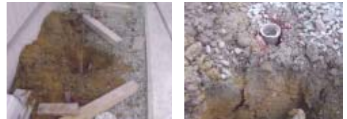
写真-5 パイプ打設 (左) とパイプ抑止効果状況 (右)