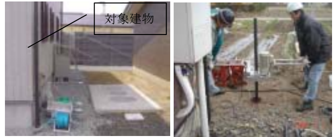
写真-3 建物と浄化槽の配置