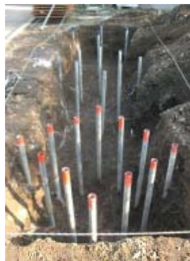
写真-1 注入固化体の掘出調査状況